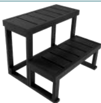
ESCALIER 2 MARCHES