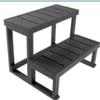
ESCALIER 2 MARCHES