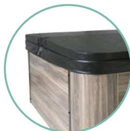
COUVERTURE ISOLANTE INCLUSE