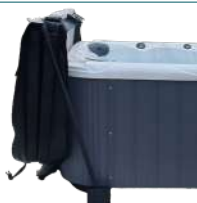
LÈVE-COUVREURE FIXATION SOUS SPA