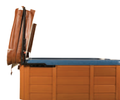
LÈVE-COUVREURE - Réf : 3049