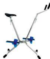
VÉLO AQUAFITNESS - Réf : 30213