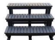
ESCALIER - Réf : 7230

RETROUVEZ L'ENSEMBLE DE NOS ACCESSOIRES SUR WWW.BE-SPA.FR